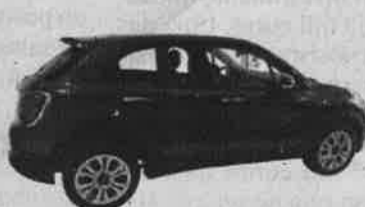
FIAT 500 X POP STAR Mês/Ano: 04/2017 | Potência: 95 cv Combustível: Gasóleo