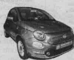
FIAT 500 LOUNGE Mês/Ano: 01/2017 | Potência: 69 cv Combustível: Gasolina