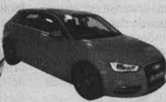
AUDI A3 SPORTBACK S LINE Mês/Ano: 04/2013 | Potência: 150 cv Combustível: Gasóleo