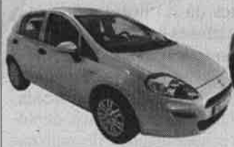
FIAT PUNTO EASY Mês/Ano: 06/2017 | Potência: 75 cv Combustível: Gasóleo

O investimento é da ordem dos 16,6 milhões de euros, e é financiado pelo Programa de Desenvolvimento Rural da Região Autónoma da Madeira - PRODERAM 2020 e pelo Governo Regional. O prazo de execução da obra é de 660 dias.