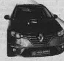
RENAULT MEGANE BREAK BOSE Mês/Ano: 12/2016 | Potência: 130 cv Combustível: Gasóleo