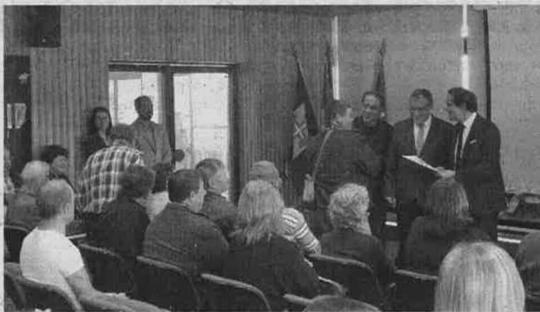
PRODERAM 2020 atingiu uma taxa de compromisso de 80%.

“Muitos deles são bons prestadores de serviços na área”, reconheceu.