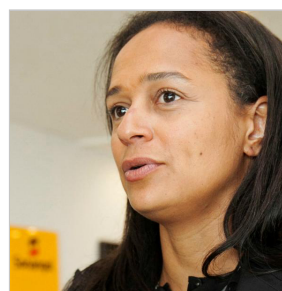
Isabel dos Santos exonera