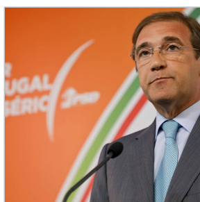
PGR pondera reabrir proc