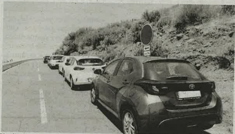
Sinalização não tem sido suficiente para impedir estacionamento abusivo.

Atualmente, decorrem os trabalhos finais da construção do Túnel do Pedregal, investimento financiado ao abrigo do PRODERAM, o qual vai permitir a melhoria do fornecimento de água aos agricultores no eixo entre a Ribeira Brava e Câmara de Lobos, beneficiando mais de 9.000 explorações agrícolas, numa área de cerca de 800 hectares, bem como criar uma importante reserva de água (cerca de 40.000 metros cúbicos) que juntamente com a diminuição das perdas de água no atual canal contribuirá para uma melhor adaptação da RAM às alterações climáticas em termos de recursos hídricos.